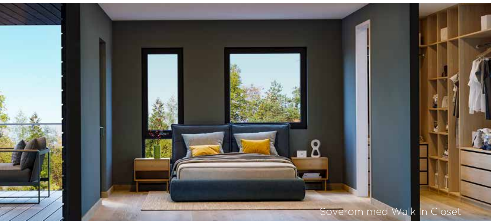
Soverom med Walk In Closet

Våre boliger har meget god standard. Boligene kan også være godt egnet til Seniorbeboere. Våre boliger kan alle kobles til fibernett. I samarbeide med kunden kan vi også tilby velfredsteknologiske tjenester som trådløs styring av boligen, trygghetsalarm etc. Mulighetene er mange.